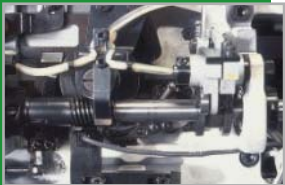
Excéntricos dobles de diseño patentizado

Seis Mecanismos Patentizados traen la tecnología de punta a la industria de la costura.