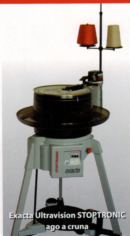
Exacta Ultravision STOPTRONIC ago a cruna

QUALITÀ RIMAGLIATA E FERMATA CON STOPTRONIC