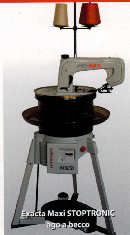
Exacta Maxi STOPTRONIC ago a becco

Le rimagliatrici EXACTA ULTRAVISION ed EXACTA MAXI sono completate da un'apparecchiatura elettronica: