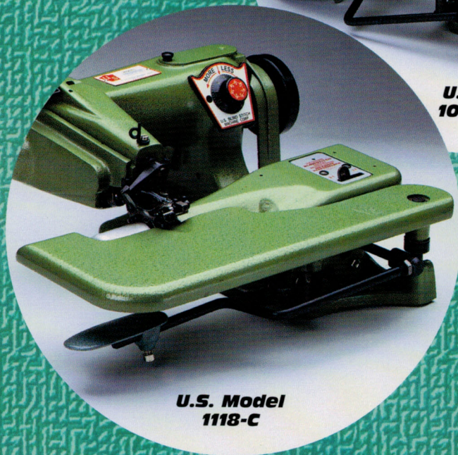
U.S. Model 1118-C

LOOK FOR THIS LOGO... FOR GENUINE U.S. BLINDSTITCH MACHINES