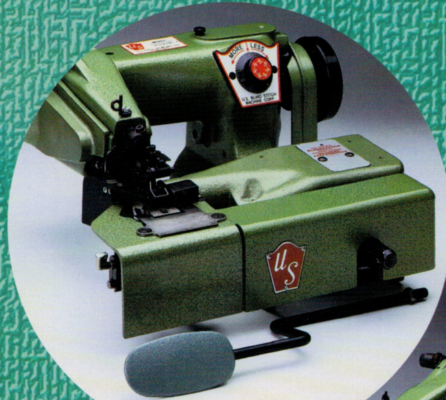
U.S. Model 1099-BL

U.S. Model 1118-2 U.S. Model 1099-J U.S. Model 928-T