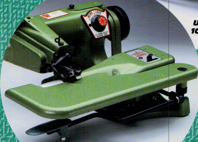
U.S. Model 1118-C

LOOK FOR THIS LOGO... FOR GENUINE U.S. BLINDSTITCH MACHINES