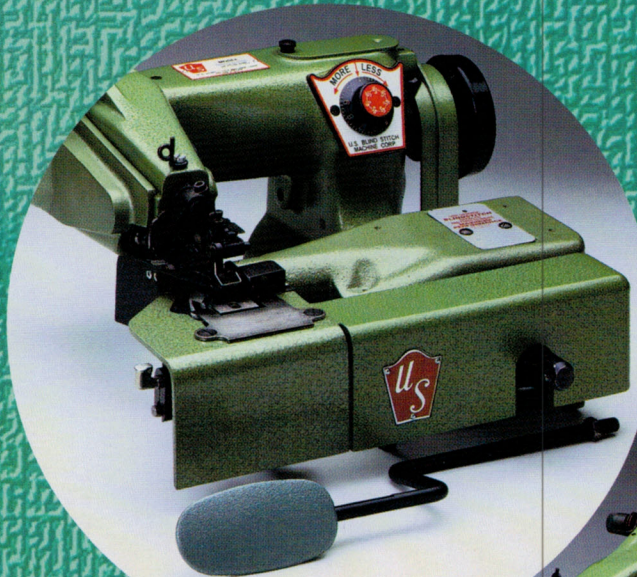
U.S. Model 1099-BL

U.S. Model 1118-2 U.S. Model 1099-J U.S. Model 928-T