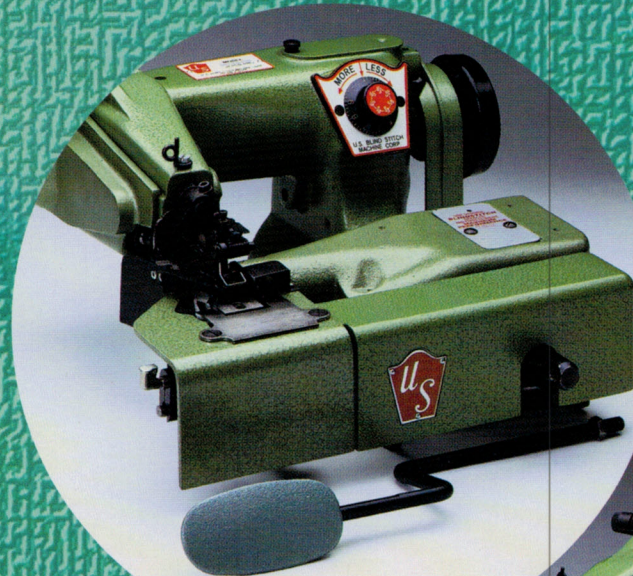
U.S. Model 1099-BL

U.S. Model 1118-2 U.S. Model 1099-J U.S. Model 928-T