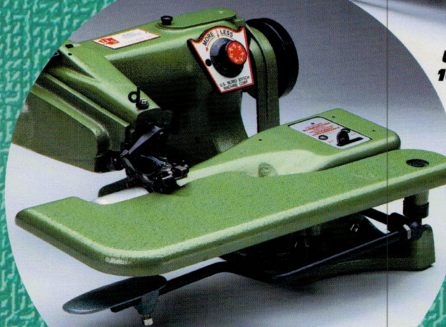
U.S. Model 1118-C

LOOK FOR THIS LOGO... FOR GENUINE U.S. BLINDSTITCH MACHINES